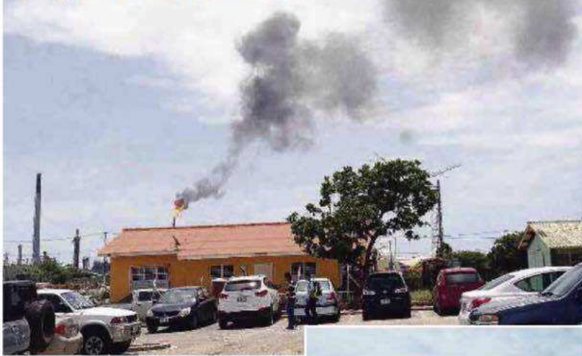
Leerlingen die de school verlaten terwijl er zich donkere rookwolken ontwikkelen.

WILLEMSTAD — De Juan Pablo Duarte School in Buena Vista moest vandaag wederom de deuren sluiten wegens rookoverlast die werd veroorzaakt door de Isla-raffinaderij. Omstreeks 12.30 uur zijn alle leerlingen en docenten naar huis gestuurd. Er zijn meerdere leerkrachten onwel geworden, zo bevestigt de woordvoerder van het ministerie van Onderwijs, Tico Vos.