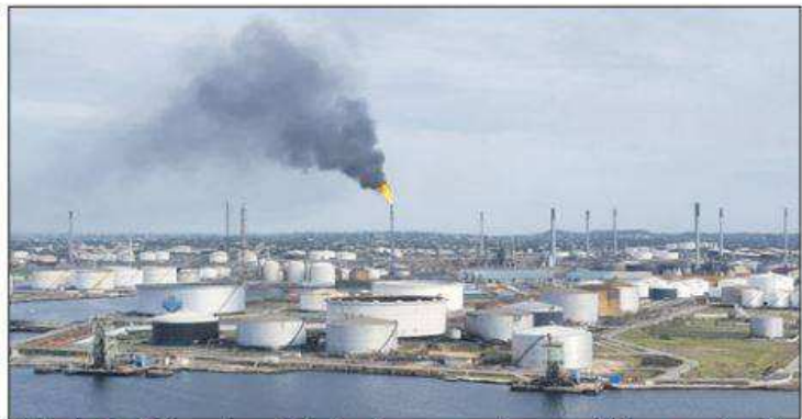
Bij de Isla-raffinaderij was gisteren in de ochtenduren een grote vlam en een dikke zwarte rookontwikkeling te zien.

Als gevolg moesten de overgebleven gassen, die niet meer gecompriëerd konden worden, worden afgefakkeld, wat tot de extreme rookontwikkeling leidde. De productie van de catcracker, kort voor fluid catalytic cracking, is tot een minimum terug-