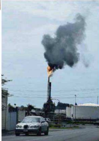
Vanochtend reikten de vlammen metershoog de lucht in.

Zie ook op pagina 3 'Affakkelen levert zwarte rookontwikkeling op na uitval Wetgas-compressor'